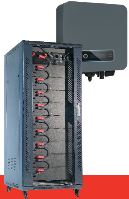
FullSet Extreme 40.20

Gwarantuje stabilność w działaniu Twojego biznesu – nieprzerwany dostęp do energii, nawet w przypadku awarii sieci, oszczędność – możliwość zmniejszenia mocy zamówionej (dzięki redukcji pików prądowych) i niezależność energetyczną - wykorzystanie do 100% zasobów wyprodukowanych przez instalację PV.