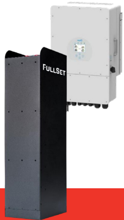
FullSet Pro 20.10

Energia jest dostępna zawsze wtedy, kiedy jej potrzebujesz: wieczorem, w nocy, w pochmurny dzień czy w przypadku awarii sieci. Możesz magazynować energię wyprodukowaną zarówno z instalacji fotowoltaicznej, jak i z sieci.